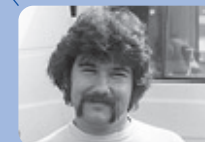
TRIPES Marty CA - Yamaha